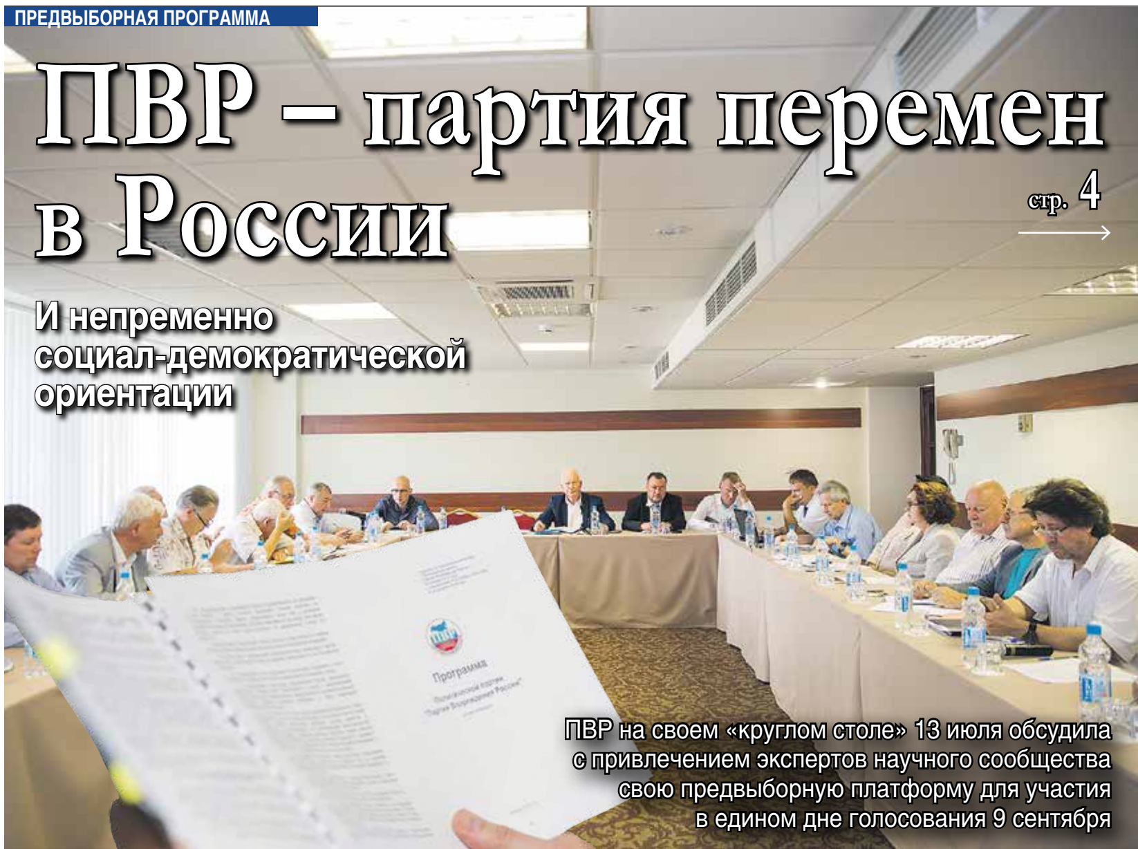
ПВР на своем «круглом столе» 13 июля обсудила с привлечением экспертов научного сообщества свою предвыборную платформу для участия в едином дне голосования 9 сентября

И непременно социал-демократической ориентации