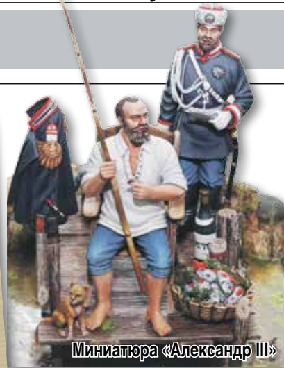
Миниатюра «Александр III»