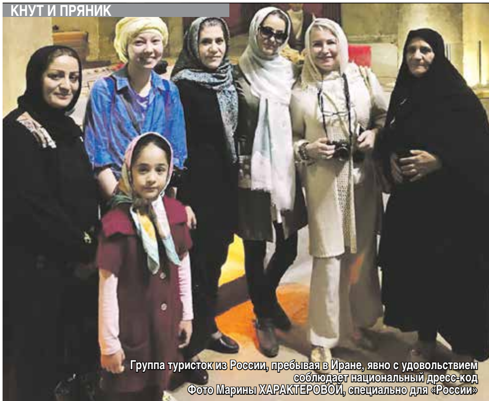
Группа туристок из России, пребывая в Иране, явно с удовольствием соблюдает национальный дресс-код

С 7 августа восстанавливается действие части санкций против Ирана, которые были заново введены Вашингтоном после выхода из СВПА в мае.