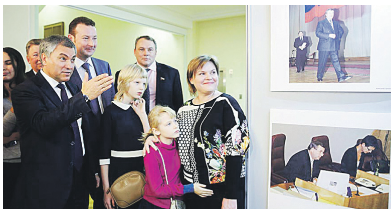
Вячеслав Володин и семья Г. Н. Селезнева в Госдуме