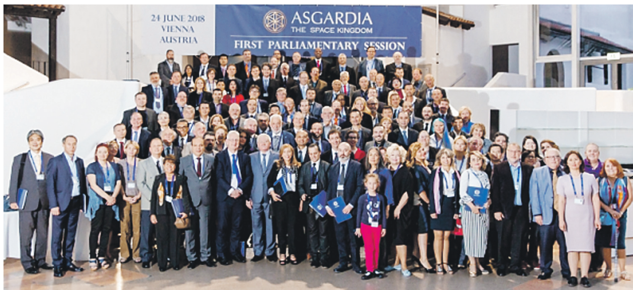
24 июня 2018 года в Вене состоялась Первая ассамблея парламента первого космического государства Асгардия