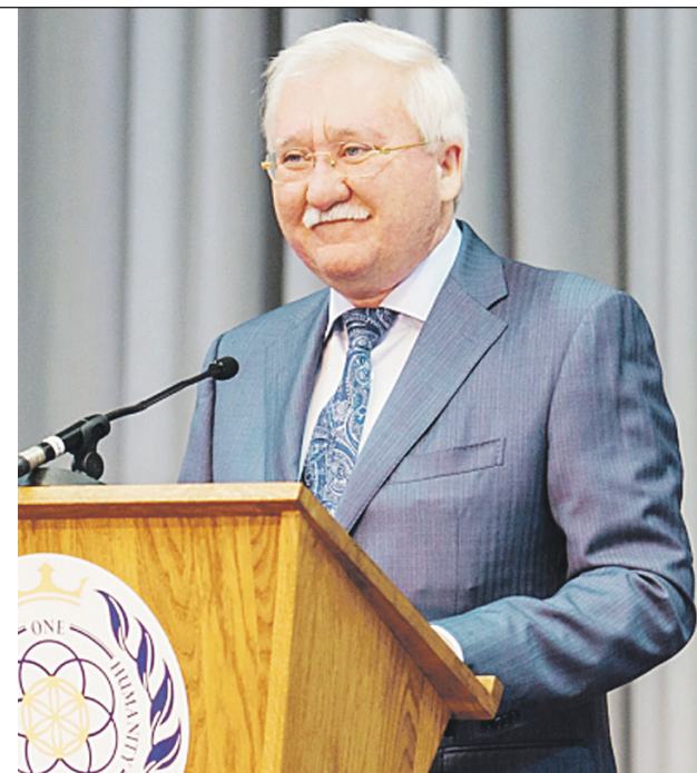
Игорь Ашурбейли на Первой ассамблее парламента Асгардии

Первым подписанным асгардианским законом Игорь Ашурбейли утвердил итоги состоявшихся выборов членов парламента космического государства. На его стартовую ассамблею прибыло более 100 человек из 146 избранных, представляющих около 40 стран мира: Россию, США, Южную Африку, Канаду, Филиппины, Великобританию, Мексику... Многоязычную аудиторию обслуживали девять бригад переводчиков – на английский, немецкий, русский, испанский, португальский, итальянский, турецкий, арабский и французский языки. В кулуарах шутили: своя ООН у Асгардии уже есть. Всех их объединила идея создания первого космического государства, озвученная Игорем Ашурбейли 12 октября 2016 года в Париже.