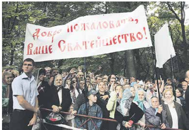
Народ Украины выступает за укрепление православной веры, за сохранение единства с Россией

В «грубом нарушении канонической территории Украинской православной церкви» обвинила Константинополь и УПЦ в опубликованном на сайте заявлении Отдела внешних церковных связей УПЦ. «Назначение экзархов в Киев состоялось без ведома блаженнейшего митрополита Киевского и всея Украины Онуфрия как единого канонического епископа города Киева, — говорится в нем. — Ответственность за возможные негативные последствия этого деяния лежит на Константинопольском патриархате». В ОВЦС УПЦ обратили внимание на то, что решение Константинопольского патриархата противоречит